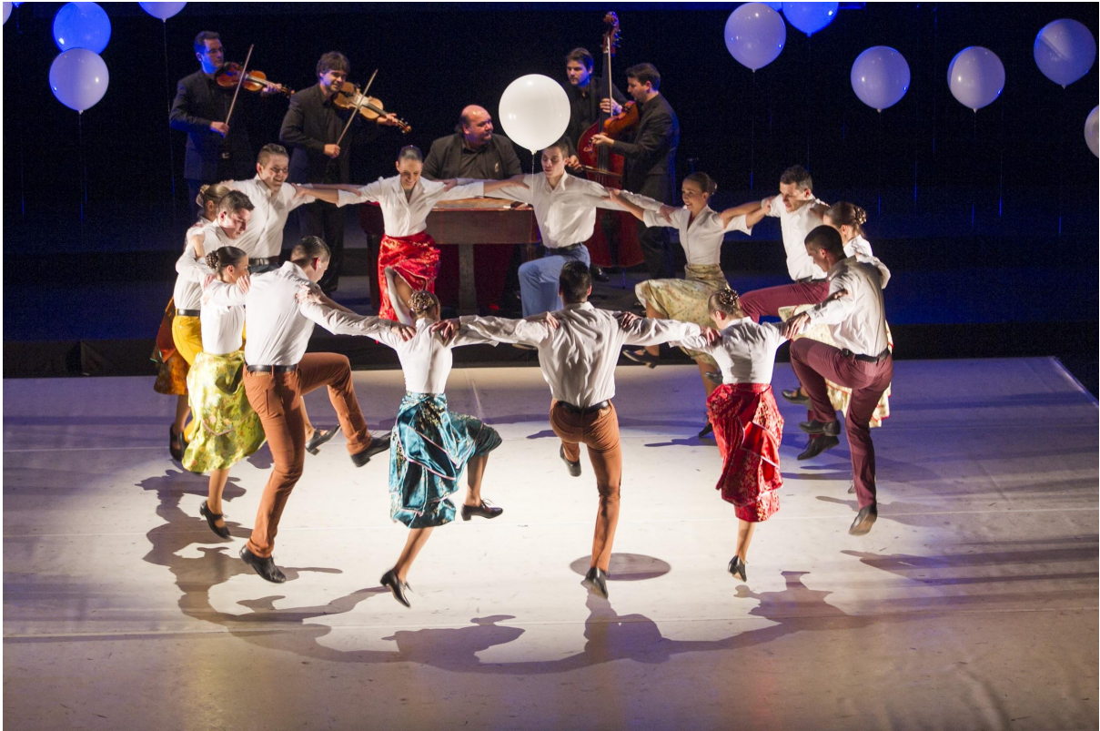
Tanečné predstavenie Kukučie vajíčko sa v roku 2020 vysielalo v on-line priestore zo záznamu dvakrát.