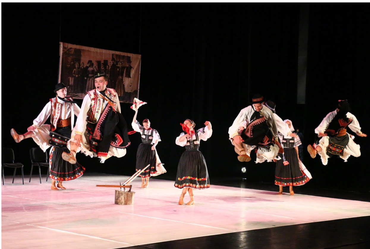
Listy v maďarskom Győri