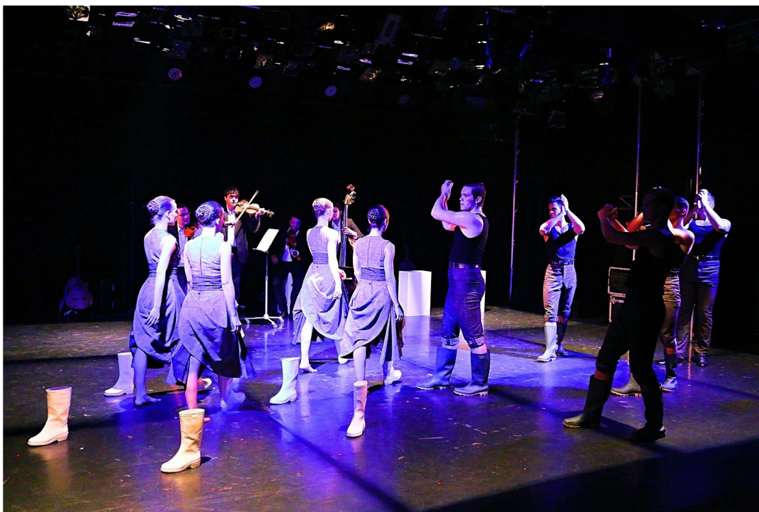
Finetuning v Avignone

“Haydnovské” sláčikové kvarteto sa nikde vo svete neujal v tradičnej hudbe jednotlivých národov a národností v takej miere ako v strednej Európe. Choreografia Finetuning využíva túto hudbu a s ňou zlúčenú organickú tanečnú kultúru ako scénický fenomén. Hovorí o živelných javoch na úrovni emócií a asociácií, ktoré človek súčasnosti zjednodušuje a často vidí len čierno-bielo. Predstavenie spracováva tému násilia v rodine, v domácnosti, v partnerských či medziľudských vzťahoch, vyvoláva v divákovi známe emócie, ktoré je nevyhnutné z času na čas doladiť.