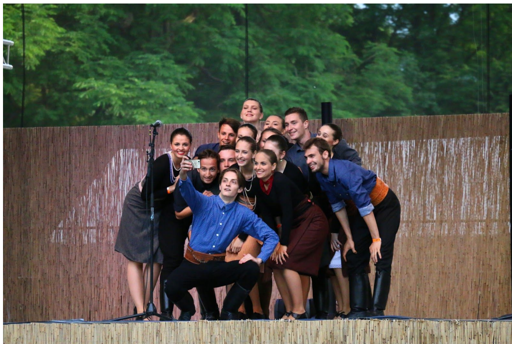
Tanečný súbor Pozsony v Želiezovciach

Tanečný súbor Pozsony je mládežníckou skupinou TDISZ, ktorej členmi sú študenti etnografickej triedy Gymnázia a základnej školy s vyučovacím jazykom maďarským v Bratislave a talentovaní mladí tanečníci z okolia Bratislavy.