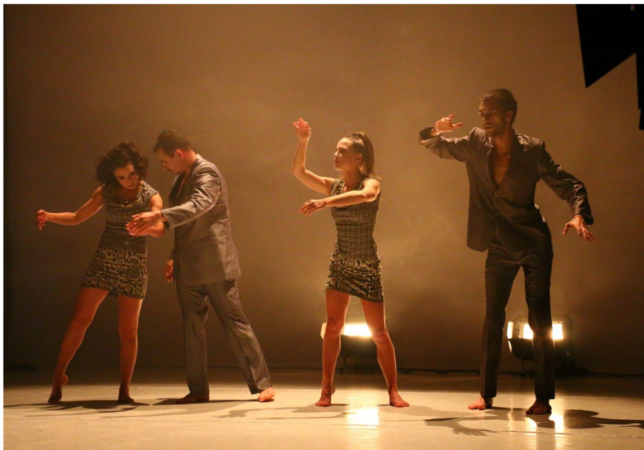
Tanečný kolektív TranzDanz z Budapesti v TDISZ

Divadelná sála TDISZ na Mostovej ulici č. 8 v Bratislave bola v roku 2016 scénou viacerých kultúrnych podujatí. Hostovali v nej divadlá, tanečné súbory, hudobné kapely a samostatní umelci, a to presne 12-krát za tento rok.