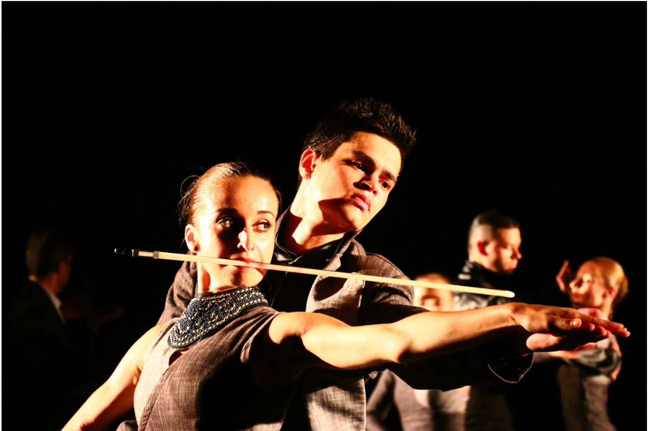
Finetuning v Avignone