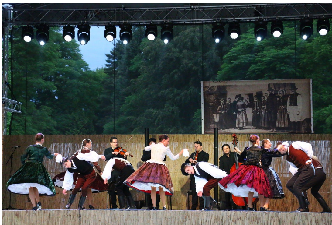
Listy v Želiezovciach

dôveryhodný ale aj rýdzo ľudský pohľad na dobu a dobovú kultúru územia “Hornej zeme”, ktorého regióny sú predstavené na základe historického a geografického členenia. V programe sa predstavujú tance a hudba Maďarov, Slovákov, Rómov, Rusínov a Židov, verne odzrkadľujú etnickú rôznorodosť územia a poukazujú na výraznú podobnosť tanečných kultúr jednotlivých národností.