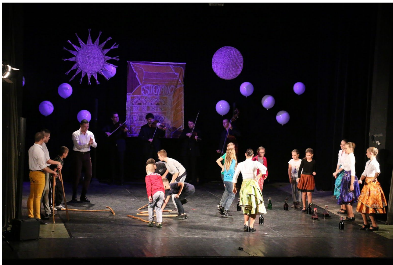
Kukučie vajíčko vo Fil'akove

Predstavenie sprevádzané živou hudbou spracováva vzťah týchto populárnych žánrov s tradičnou ľudovou kultúrou vo forme, vďaka ktorej sa divák v zásade dobre zabaví, navyše sa dostane aj o krok bližšie k autentickému ľudovej kultúre.