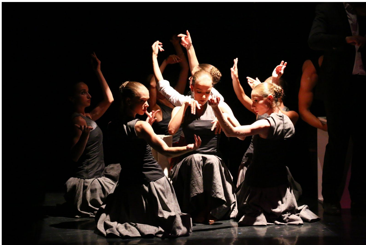
Finetuning v Avignone