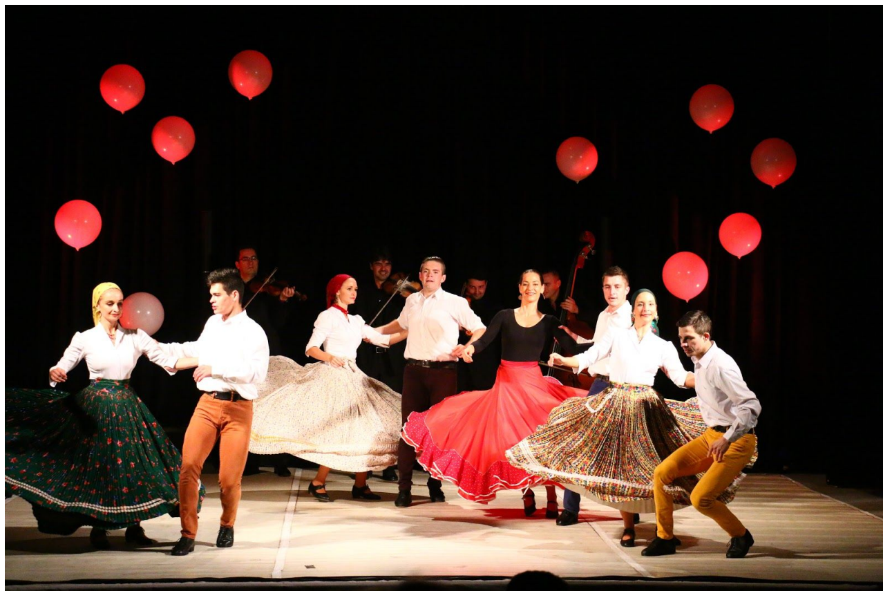
Kukučie vajičko v Košiciach