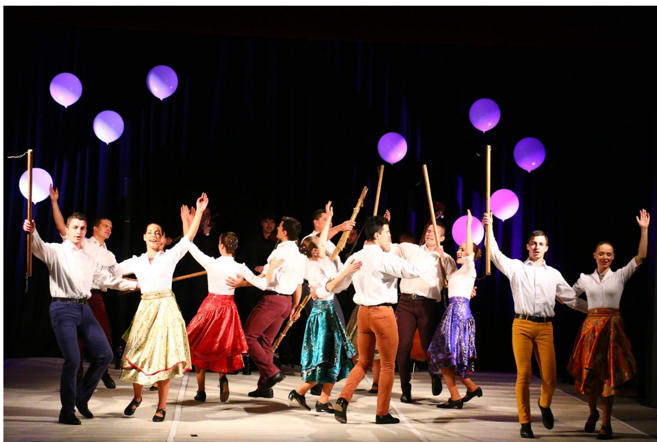
Kukučie vajíčko v Kráľovskom Chlmci

Každý z nás sa už v prvých ročníkoch základnej školy oboznámil s úlohami typu “kukučie vajíčko”. Všetci rozoznáme hrušky od jablák, ale poradíme si aj napríklad s flamencom ukrytým v choreografii cigánskeho tanca? Celovečerný program TDISZ predstavuje tradičnú ľudovú hudbu spolu s tancom v kontexte, ktorý je pre človeka 21. storočia dobre známy.