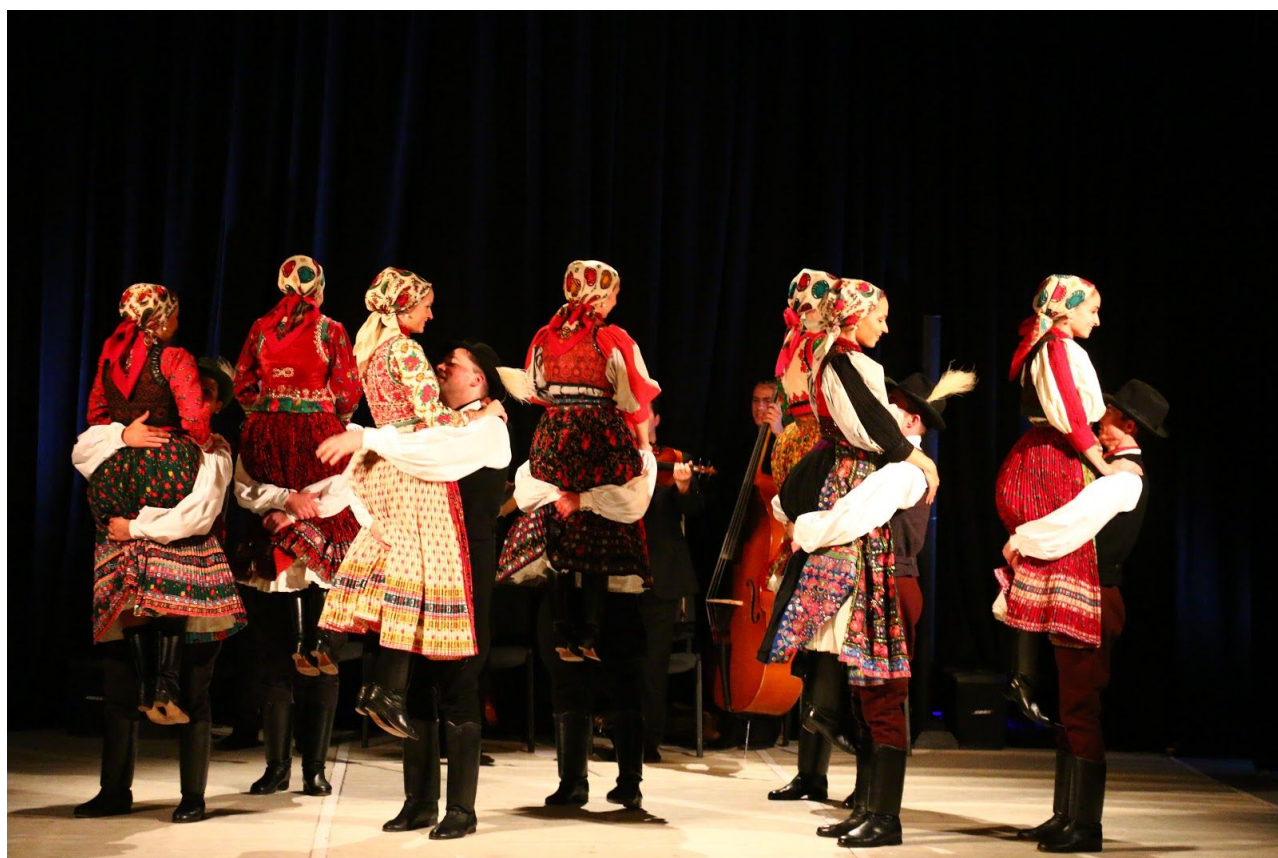
Bartók 135 v Kráľovskom Chlmci

spája s Bratislavou. Koncom 19. storočia totiž študoval na gymnáziu práve v hlavnom meste, a to na Špitálskej ulici.”