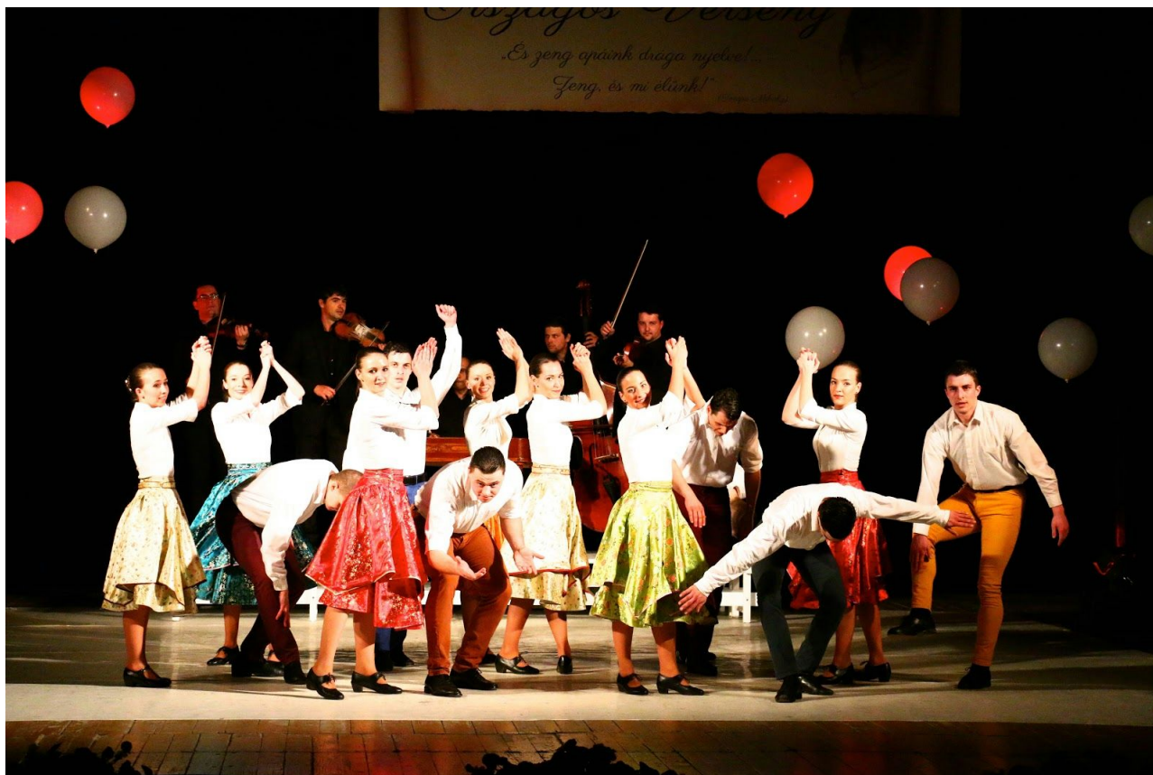
Kukučie vajíčko v Rimavskej Sobote

Kukučie vajíčko sa v roku 2015 hralo 30-krát, z toho 13-krát vo forme výchovno-vzdelávacieho programu pre deti a mládež. Program si pozrelo vyše 6 800 divákov, z toho vyše 5 000 detí.