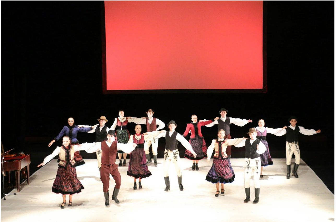
Tanečný súbor Pozsony na Jubilejnom galaprograme TDISZ