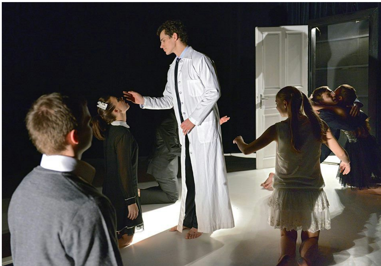
Tanečný kolektív Divadla Gárdonyi Géza z Eger v TDISZ

Divadelná sála TDISZ na Mostovej ulici č. 8. v Bratislave bola v roku 2015 scénou viacerých kultúrnych podujatí. Hostovali v nej divadlá, tanečné súbory, hudobné kapely, aj samostatní umelci presne sedemkrát za tento rok.