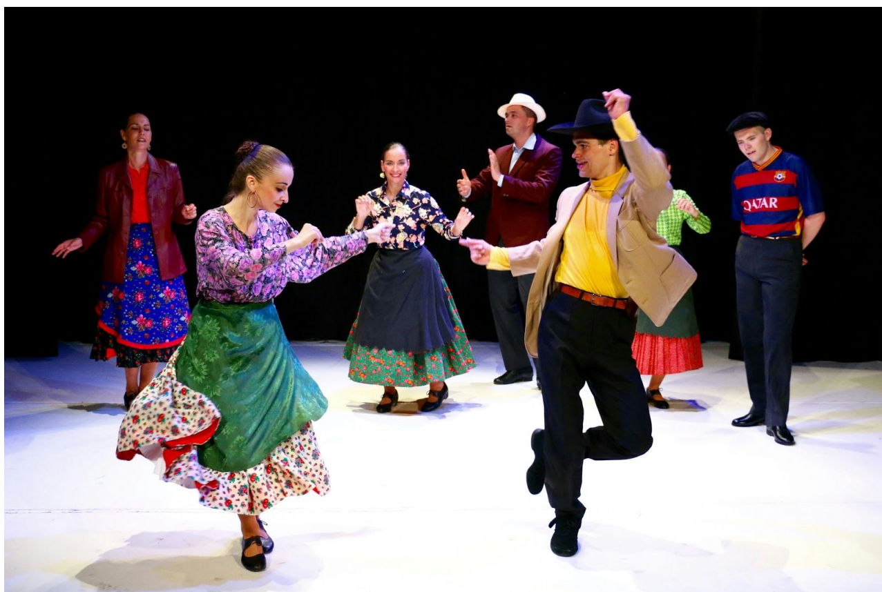
Listy v TDISZ na Mostovej 8.

V programe sa predstavia tance a hudba Maďarov, Slovákov, Rómov, Rusínov a Židov, verne odzrkadľujúc etnickú rôznorodosť územia a poukazujúc na výraznú podobnosť tanečných kultúr jednotlivých národností.