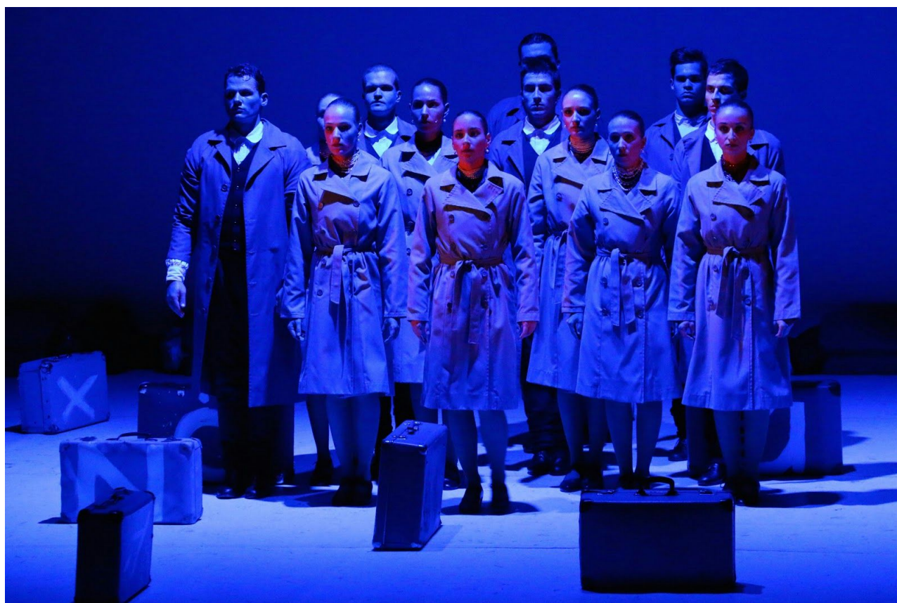
Vyvlastenie v Paláci umenia v Budapešti