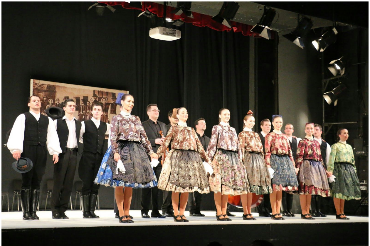
Listy v Sfantu Gheorge v Rumunsku

Počas uplynulých desiatich rokov mohlo domáce aj maďarské publikum vďaka Listom hlbšie spoznať autentickú tradičnú tanečnú kultúru. Tanečné divadlo si touto celovečernou choreografiou získalo uznanie slovenských aj maďarských odborníkov a vďaka nej sa viacero rôznych umeleckých kolektívov začalo zaoberať tancami z južného Slovenska.