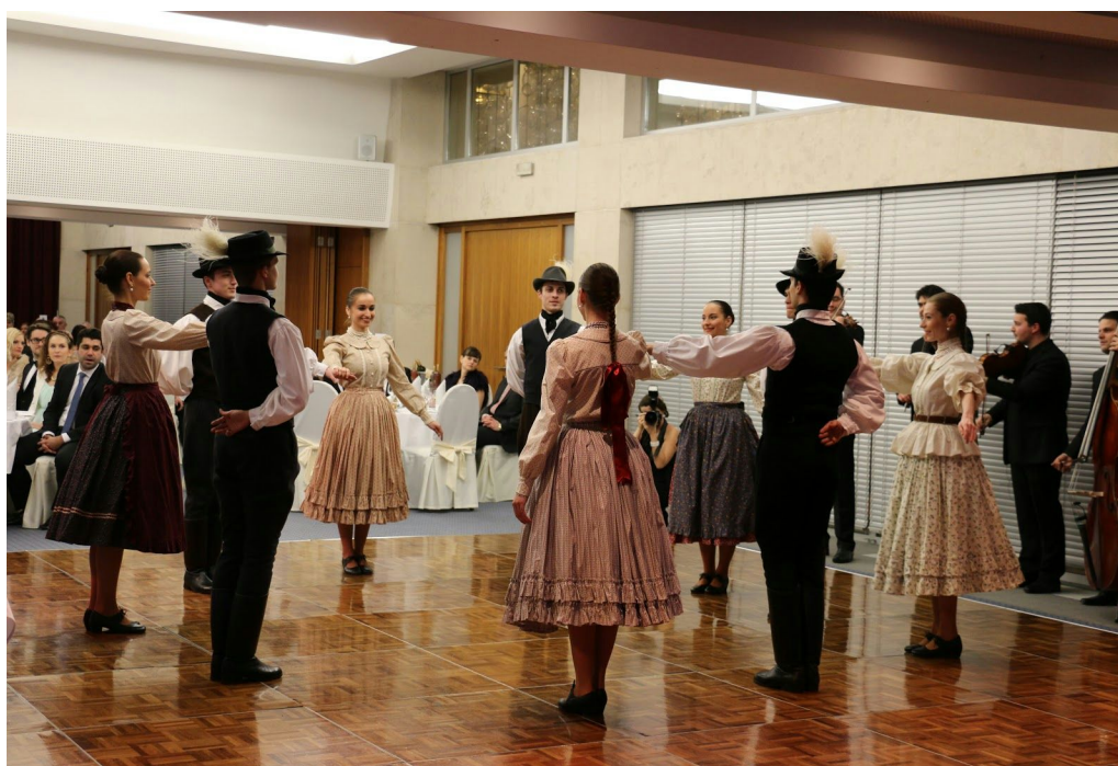
Tance z Bratislavy na plese UV SR

Pestrosť predstaveného tanečného a hudobného umenia a vzrušujúce obrazy tohto predstavenia zavedú diváka 21. storočia do tajuplného sveta časov, v ktorých tanec a hudba boli ešte súčasťou každodenného života. V tanečnej inscenácii je sparcované tradičné tanečné a hudobné umenie Maďarov, Slovákov, Rumunov a Rómov žijúcich v Strednej Európe.