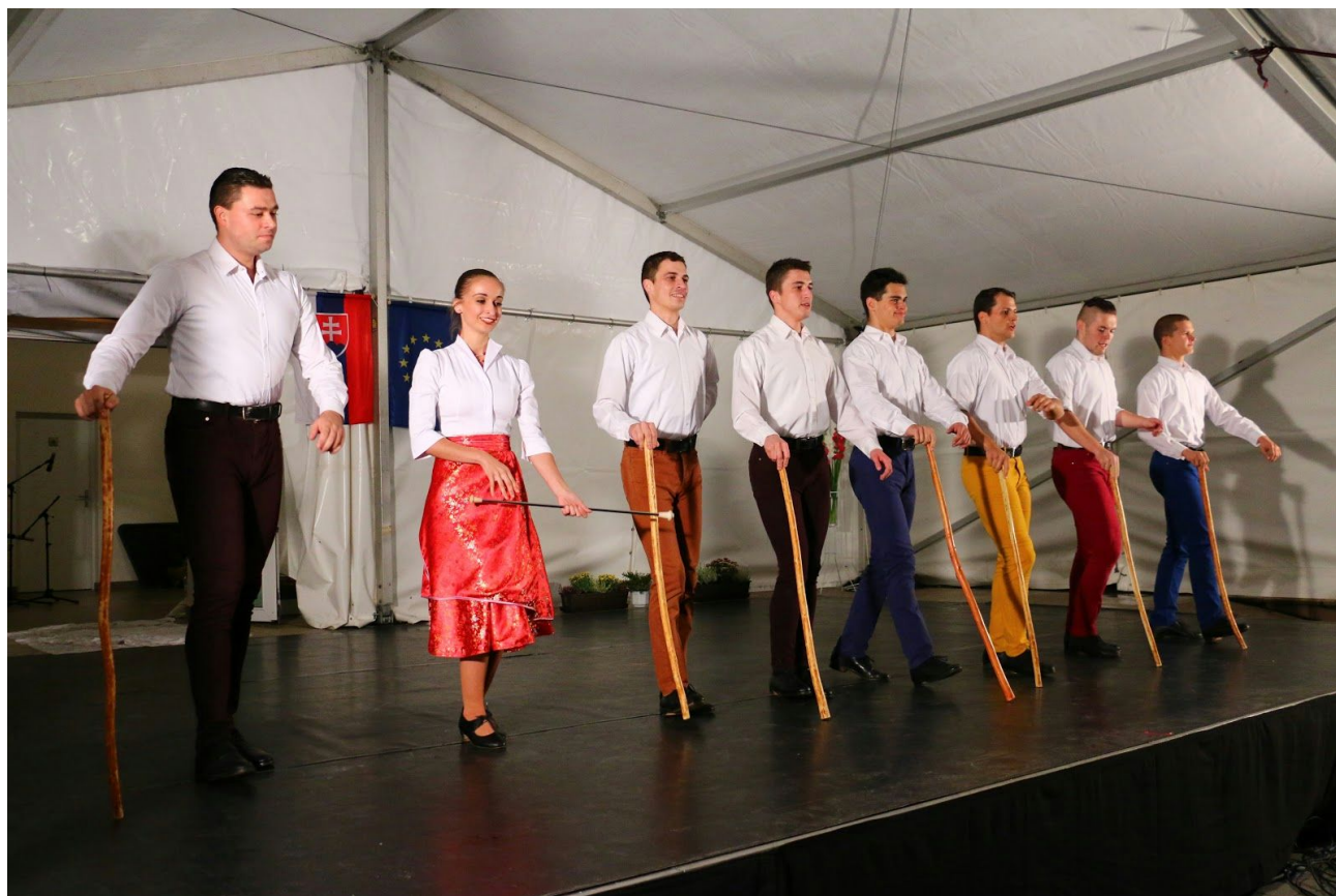
Kukučie vajíčko v Jarovciach

forme, vďaka ktorej sa divák v zásade dobre zabaví, ale dostane sa aj o krok bližšie k autentickému ľudovej kultúre.