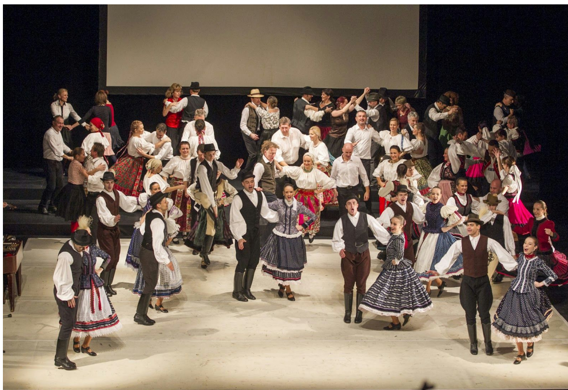
Jubilejný galaprogram TDISZ v Mestskom divadle P. O. Hviezdoslava

Ifjú Szivek oslavovalo v roku 2015 dvojité jubileum – 60. výročie založenia a 15. výročie vzniku tanečného divadla. Okrem jubilejného roka sa v septembri začala aj slávnostná sezóna, ktorá zvýšila navštevovanosť tanečného divadla na Mostovej ulici 8. v Bratislave. Súčasťou tejto sezóny bol aj jubilejný galaprogram v Mestskom divadle P. O. Hviezdoslava v Bratislave, kde sa predstavilo viac než 7 generácií a vyše 160 súčasných a bývalých tanečníkov a spevákov z jednotlivých období uplynulých šesťdesiatich rokov Ifjú Szivek. Cieľom projektu bolo aj to, aby sídlo bratislavského Ifjú Szivek rozšírilo spektrum kultúrnych podujatí v hlavnom meste a tým ponúklo pestrejší výber milovníkom kultúry a divadla v Bratislave. Tanečné divadlo v srdci hlavného mesta ponúka ľudové umenie, divadlo a tanec profesionálov pre všetkých.