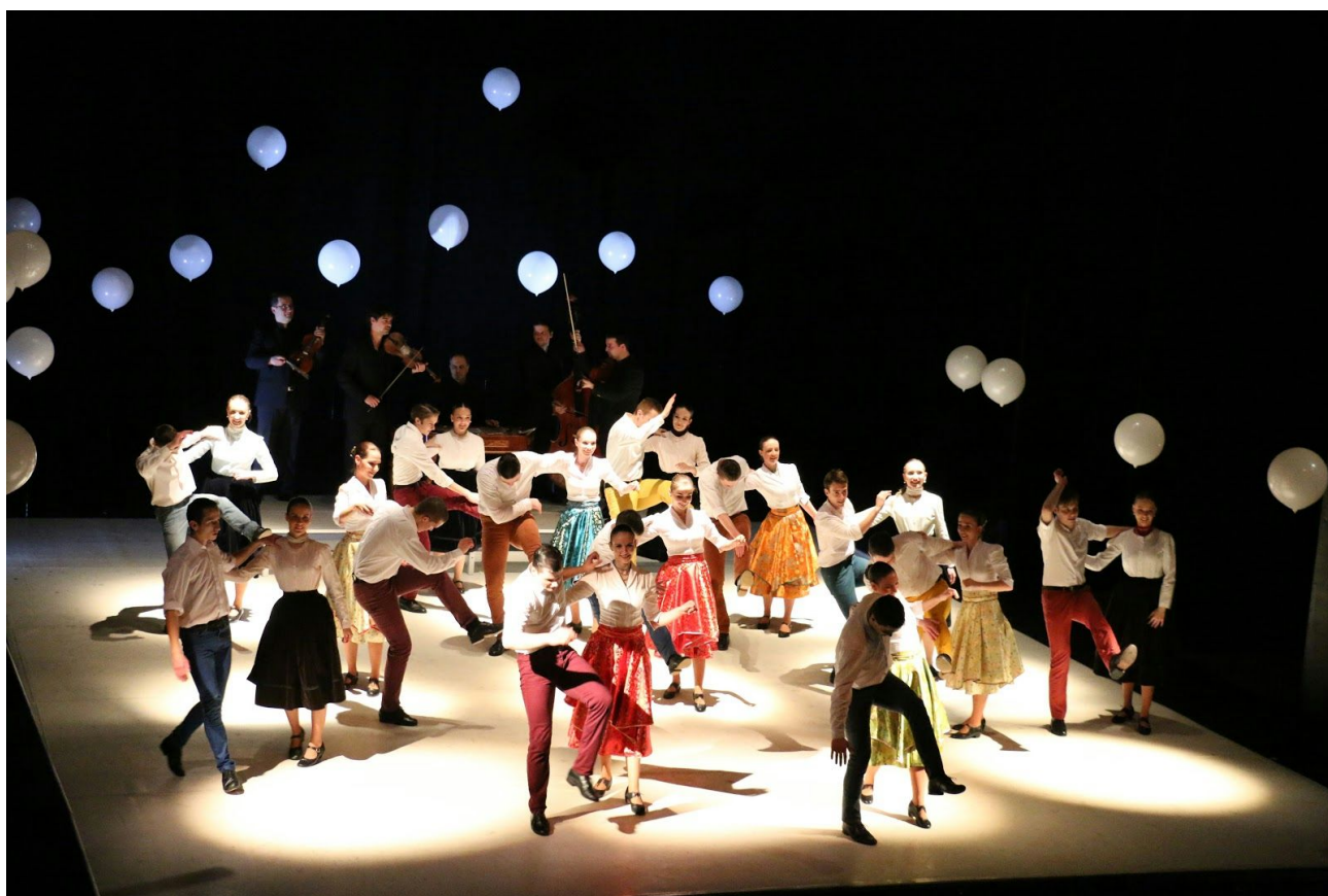
Kukučie vajíčko na Jubilejnom galaprograme TDISZ

Každý z nás sa už v prvých ročníkoch základnej školy oboznámil s úlohami typu "kukučie vajíčko". Všetci určite rozpoznáme hrušku medzi jablkami, ale poradíme si aj napríklad s flamencom ukrytým v choreografii cigánskeho tanca? Celovečerný program Tanečného divadla Ifjú Szivek predstavuje tradičnú ľudovú hudbu spolu s tancom v kontexte, ktorý je pre človeka 21. storočia dobre známy.