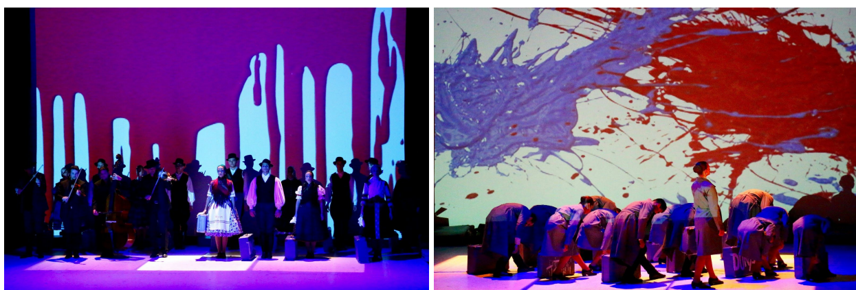
Vyvlastenie v Paláci umenia v Budapešti

Predstavenie spracúvava tradičnú tanečnú a hudobnú kultúru Maďarov, dodnes žijúcich na území Slovenska. O živelných javoch hovorí na úrovni emócií a asociácií. Všetci sme produktom súhry rôznych kultúr, ideológií a príbehov. Napriek tomu v mnohých z nás žije nevysvetliteľná túžba vyhnúť sa všetkému, čo je "iné". Výsledkom trvalej izolácie je však vylúčenie, nech už je reč o ktorejkoľvek oblasti života. Otázkou zostáva už len to, či vylučujeme alebo sami sme vylúčení.